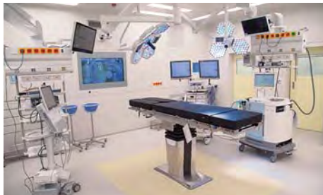
Nový operační sál je vybaven nejmodernějšími technologiemi

„Operační sály Kliniky transplantační chirurgie IKEM budou patřit mezi nejmodernější v České republice. Usnadní a příjemní práci zaměstnancům,