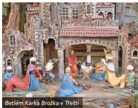
Betlém Karka Brožka v Třešti

Učitel a muzikant Jáchym Metelka začal s budováním svého betlému v roce 1883 a dokončil ho v roce 1913. Betlém je v současnosti umístěn v muzeu v Jilemnici a jeho mechanická část dodnes bez problémů funguje. Celkem 142 postav a objektů, které vykonávají 350 různých pohybů, pohání jediný hnací stroj se závažím, které se zvedá ručně klikou. Další tři stroje se stejným principem slouží k ozvučení. Kromě klasických figur je zde například cvičenec Sokola na hrazdě, na palmě sedící kukačka